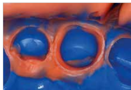
Přesný otisk z materiálu V-Posil