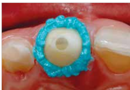
Nanesená VOCO Retraction Paste